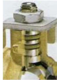
ΔΙΠΛΟ O-RING "Viton"